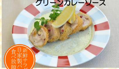
鶏もも肉のナッツと ドライフルーツ包み グリーンカレーソース