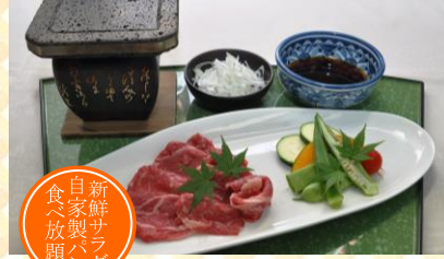
溶岩焼シャブシャブ

まさに・・・パンをたくさん食べたくなるメ ニュー！じっくり煮込んだハンバーグはソー スも旨味がいっぱい！