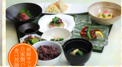
やまもも流ミニ会席