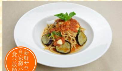
モッツアレラチーズと ナスのパスタ

オリジナルタルタルソースは 豚肉の南蛮にも ピッタリです お好きなだけかけてめしあが れ！