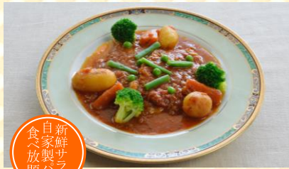
豚ロースの煮込み温野菜添え