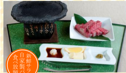
宮崎ハーブ牛溶岩焼ステーキ

オリジナルの出汁を加えたオリーブオイルに 具材の旨味が溶け込んで、食欲をそそる一品