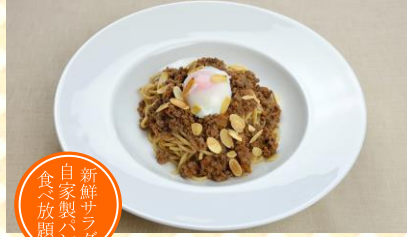
牛肉ラグーとアーモンドのパスタ 温泉たまごのせ