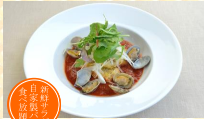
白身魚のフリット ソースボンゴレ

農大粉100%の自家製パスタです もちもちパスタにトマトベースのソースがよく 合います。