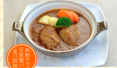
煮込みハンバーグ(国産肉使用)

ジューシーなもも肉の旨味、ナッツの食感と ドライフルーツの甘みが口のなかで競い合い、 ソースがそれをひきたてます。