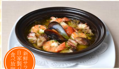
やまもも流アヒージョ