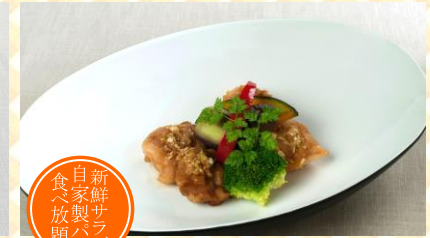
鶏の香味ソース和え