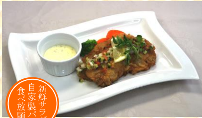
ポーク南蛮 玉子いっぱいタルタルソース

当店一番人気。 辛いけど、何となく甘い！ ささらただけど 何となくまったり！ 自信作です。