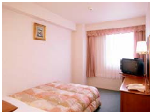
シングルルーム 〈Single Room〉