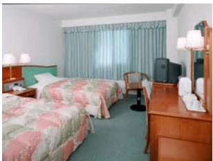
ツインルーム 〈Twin Room〉